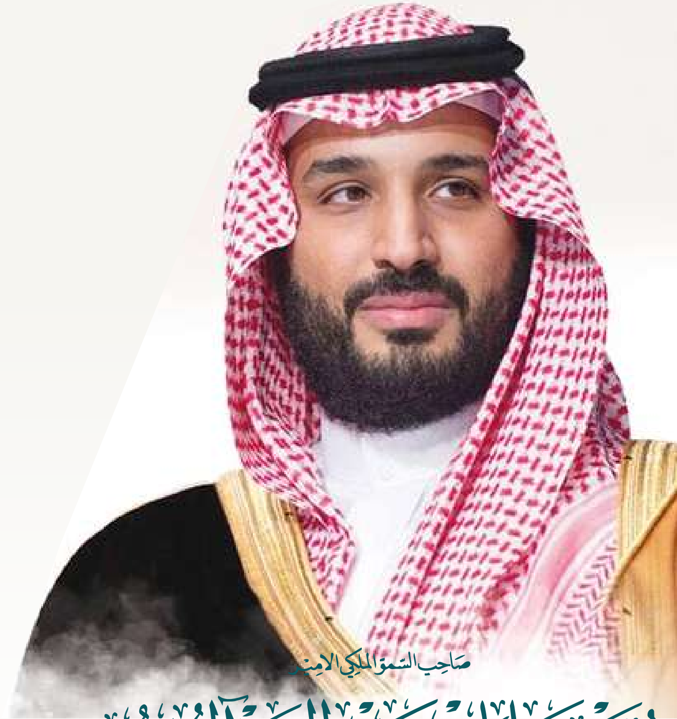
صاحب السمو الملكي الأمير